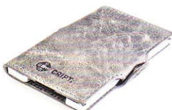
3.55 STEEL GREY 355-503