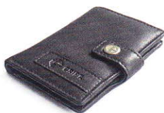
4.45 BLACK 445-500