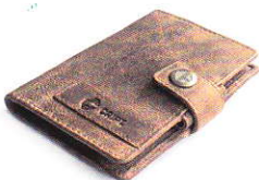
4.45 BROWN 445-502