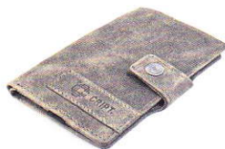
4.45 GREY 445-503