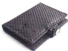
4.15 CARBON 415-501