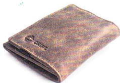
3.77 BROWN 377-502