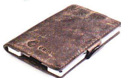
3.55 STEEL BROWN 355-502