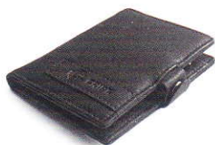
4.15 BLACK 415-500