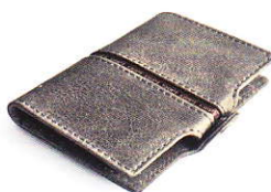
4.15 ACE GREY 415-505