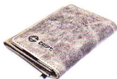
3.77 GREY 377-503