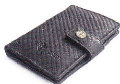
4.45 CARBON 445-501