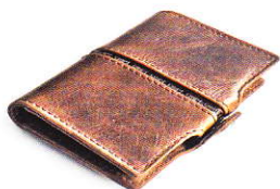
4.15 CLASSIC COGNAC 415-504