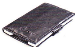
3.55 STEEL BLACK 355-500