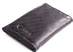
3.77 BLACK 377-500