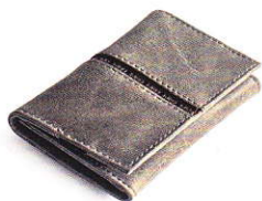
3.77 ACE GREY 377-505