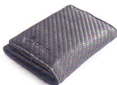
3.77 CARBON 377-501