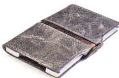
3.55 STEEL ACE GREY 355-505