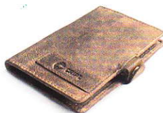
4.15 BROWN 415-502