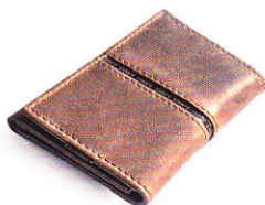
3.77 CLASSIC COGNAC 377-504