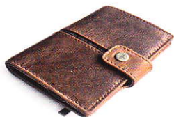
4.45 CLASSIC COGNAC 445-504