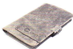
4.15 GREY 415-503