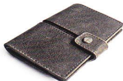
4.45 ACE GREY 445-505