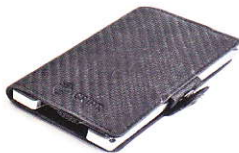
3.55 STEEL CARBON 355-501