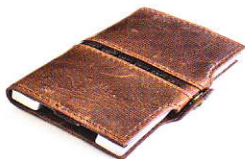
3.55 STEEL CLASSIC COGNAC 355-504